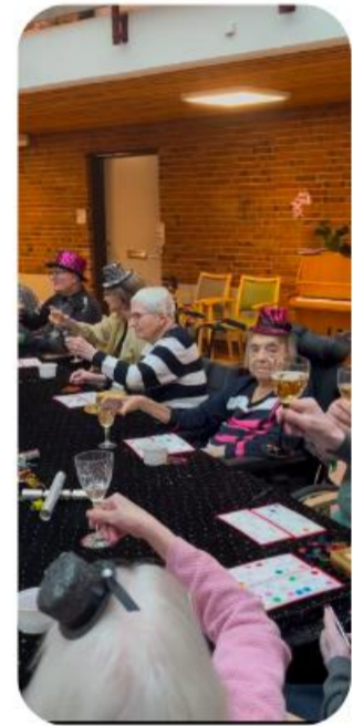
Nytårsaftensdag iførte vi os nytårshatte, og spillede nytårsbanko. Vi glemte dog ikke at skåle i champagne og spise kransekage til.